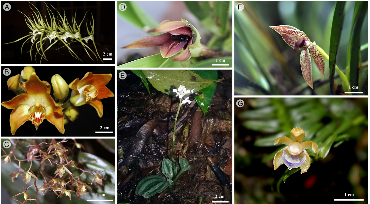
Figura 1: A. Brassia verrucosa Lindl.; B. Chysis laevis Lindl.; C. Epidendrum diffusum Sw.; D. Maxillaria cucullata Lindl.; E. Cranichis sylvatica A. Rich. & Galeotti; F. Maxillaria meleagris Lindl.; G. Dichaea suaveolens Kraenzl.