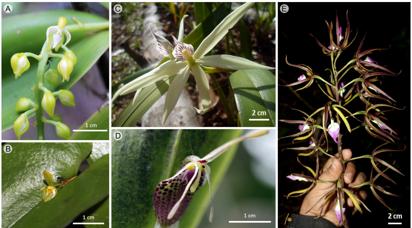
Figura 3: A. Notylia orbicularis A. Rich. & Galeotti; B. Pleurothallis antonensis L.O. Williams; C. Prosthechea baculus (Rchb. f.) W.E. Higgins; D. Restrepia muscifera (Lindl.) Rchb. f. ex Lindl.; E. Prosthechea brassavolae (Rchb. f.) W.E. Higgins.