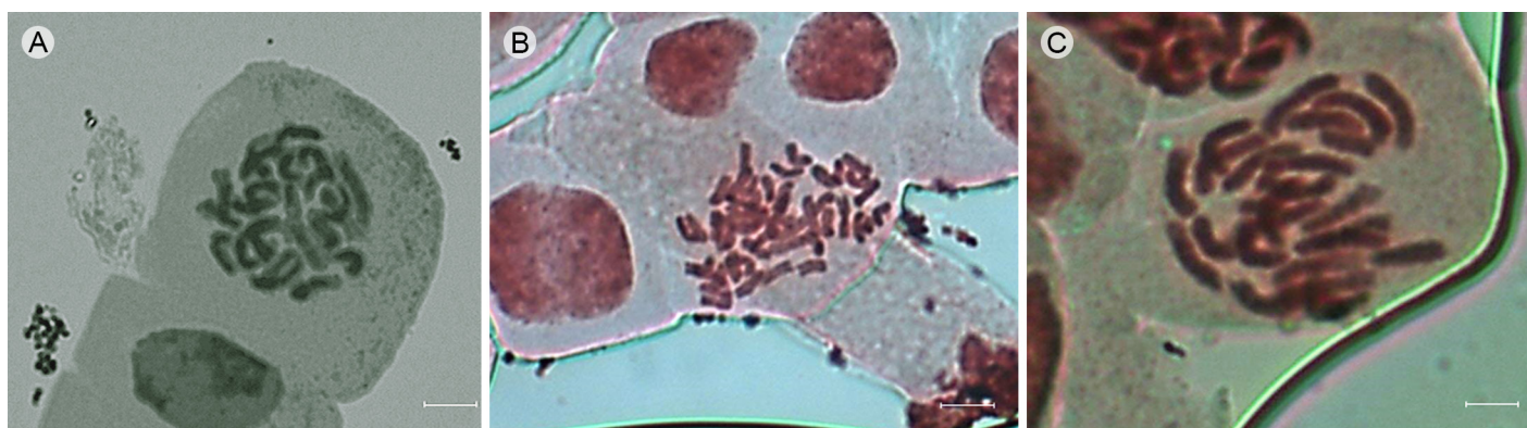
Figura 1: Cromosomas en metafase mitótica para tres especies de Cosmos Cav. sección Discopoda (DC.) Sherff. Escala=5 \mu m. A. Cosmos nitidus Paray ( 2n=2x=24 ); B. Cosmos pseudoperfoliatus Art. Castro, Harker & Aarón Rodr. ( 2n=4x=48 ); C. Cosmos ramirezianus Art. Castro, Harker & Aarón Rodr. ( 2n=2x=24 ).

la aneuploidía, poliploidía y los rearrreglos estructurales a nivel cromosómico han sido determinantes para la evolución de las especies sudamericanas y norteamericanas de los géneros Stevia Cav. y Solidago L., respectivamente. Así mismo, Malallah et al. (2001) encontraron en diferentes poblaciones de Picris babylonica Hand.-Mazz. una amplia serie cromosómica aneuploide que fue relacionada con una variación en el desarrollo de capítulos homocárpicos o heterocárpicos. La aneuploidía en Cosmos es un área de oportunidad en la investigación y su examen a fondo podría revelar procesos evolutivos importantes en el género.