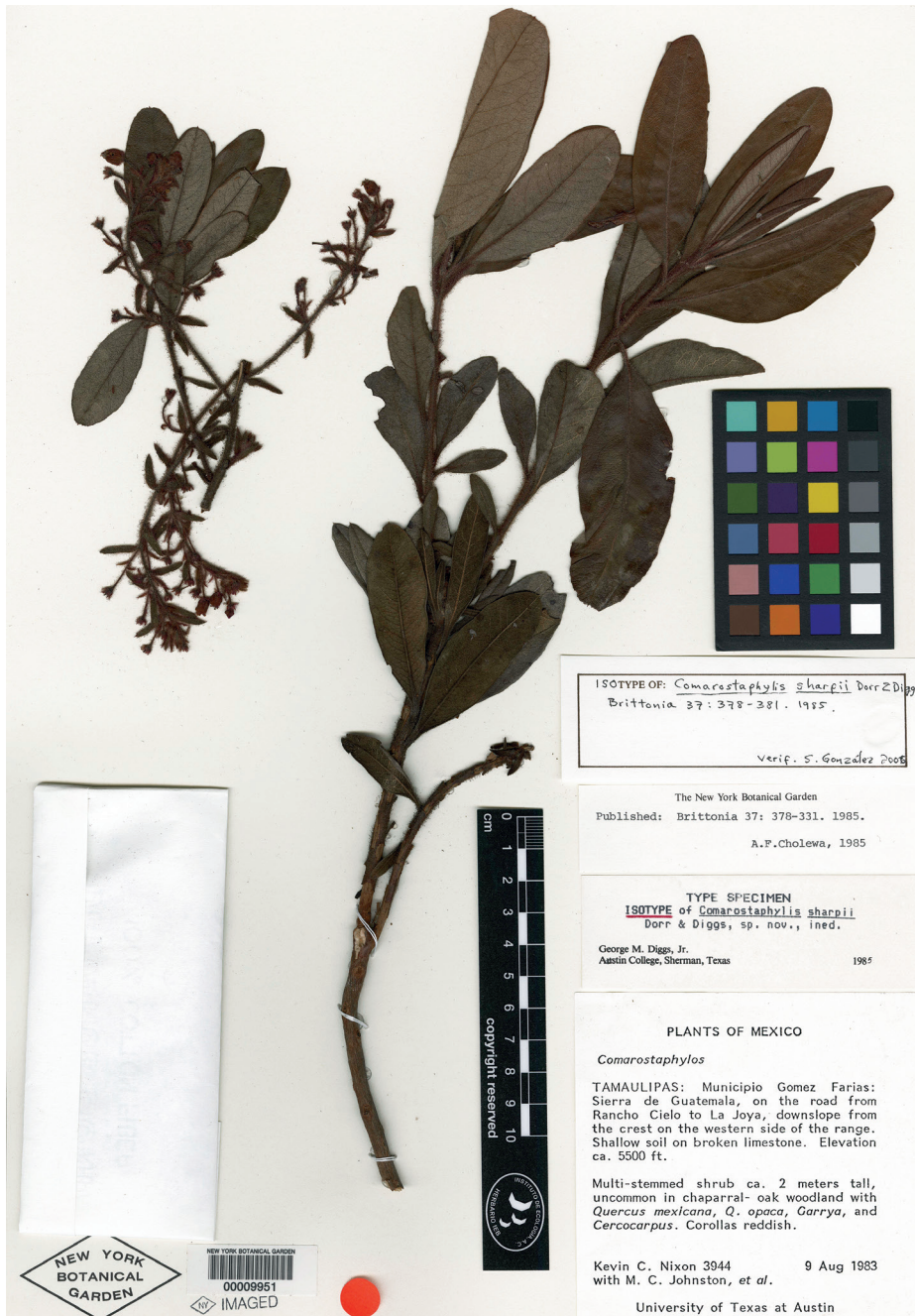
Fig. 5. Comarostaphylis sharpii . Imagen de isotipo en NY.