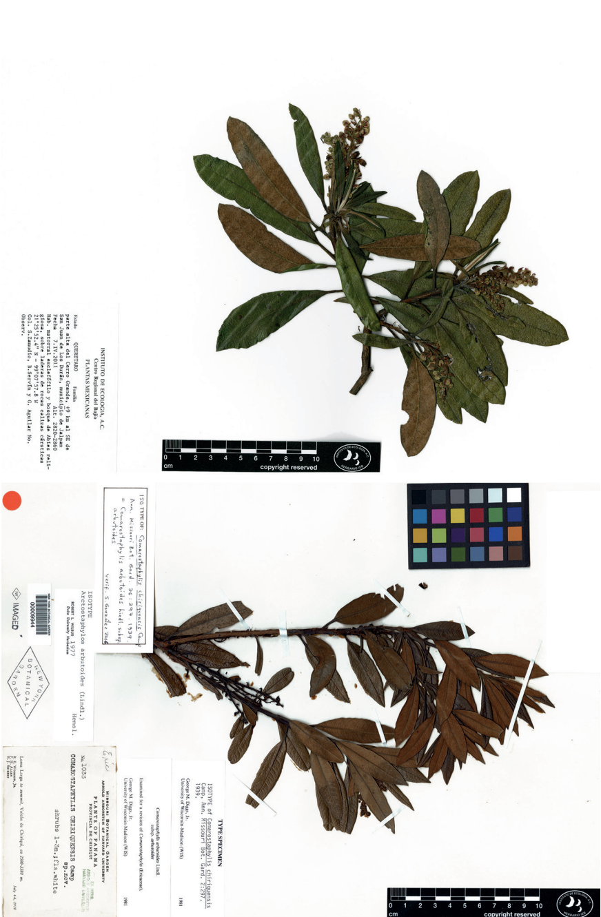
Fig. 2. Comarostaphylis arbutoides s.l. A: ramilla con inflorescencias, Querétaro (S. Zamudio et al. 15078, IEB); B: isotipo de Comarostaphylis chiriquensis (sinónimo de C. arbutoides ), Panamá (R.E. Woodson et al. 1033, NY).