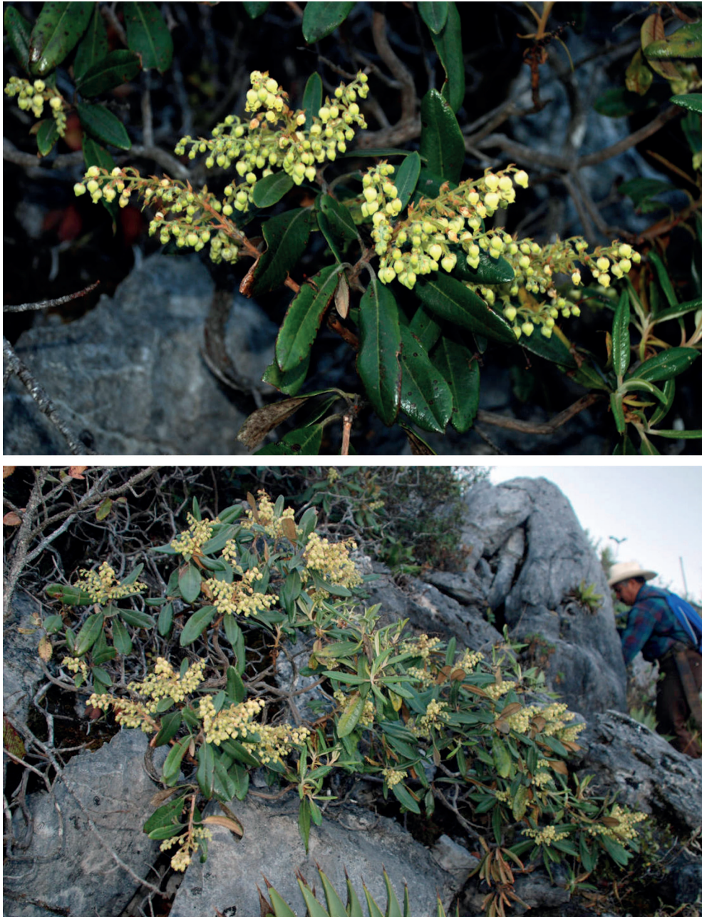
Fig. 3. Comarostaphylis arbutoides s.l. en Querétaro: A. inflorescencias; B. hábito.