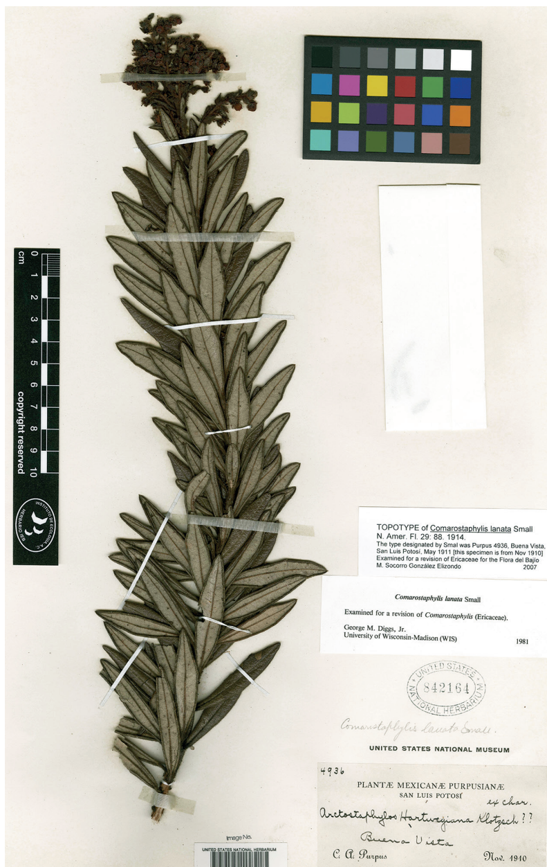
Fig. 4. Comarostaphylis lanata . Imagen de isotipo en US. Aunque el número de colecta corresponde al del tipo, la muestra fue colectada en Noviembre de 1910 y no en Mayo de 1911 (fecha de colecta del tipo). Dado que Purpus colectó en la misma región en 1910 y en 1911, es probable que este espécimen deba considerarse como topotipo.