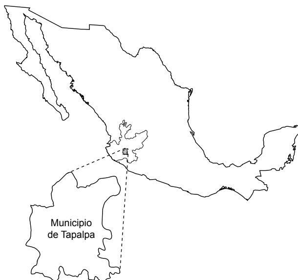
Fig. 1. Ubicación geográfica del municipio de Tapalpa en Jalisco y en México.

áreas por el tropical caducifolio y el mesófilo de montaña (Rzedowski, 1978). Las 11 exploraciones realizadas se concentraron en las tres primeras comunidades vegetales mencionadas, durante los meses de lluvias, de junio a octubre de 2000 al 2003. Desafortunadamente toda la zona estudiada tiene un alto grado de deforestación, debido a intensas prácticas agrícolas, ganaderas y de explotación de madera.