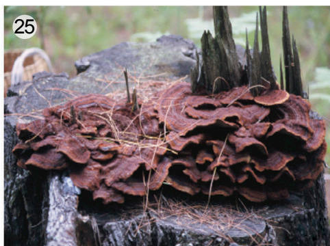
Figs. 20-25. 20. Lyophyllum decastes . 21. Macrolepiota procera . 22. Suillus tomentosus . 23. Cantharellus cibarius . 24. Albatrellus ellisii . 25. Phaeolus schweinitzii .