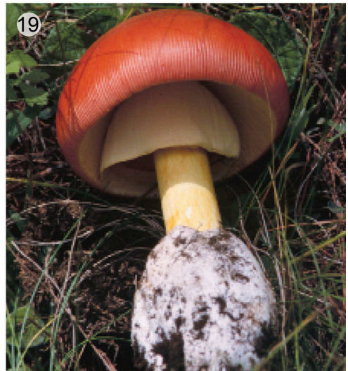
Figs. 16-19. 16. Hypomyces lactifluorum . 17. Helvella crispa . 18. Amanita laurae . 19. A. tecomate .