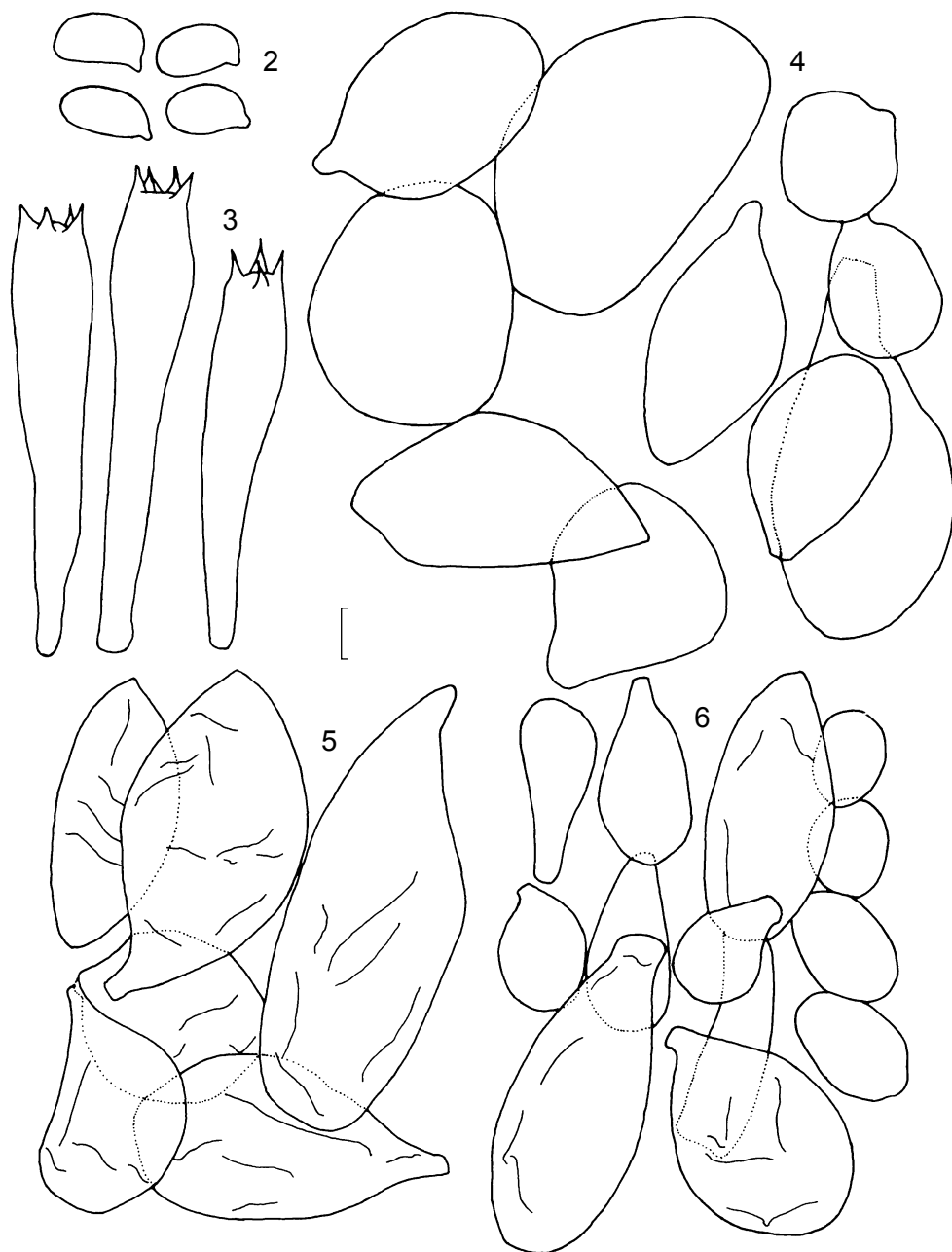
Figs. 2-6: Amanita austrostraminea (Gándara 185). 2. basidiosporas; 3. basidios; 4. células marginales de la lámina; 5. células del velo sobre la base del estípite; 6. células del velo sobre el píleo (escamas). Escala figs. 2-3 = 8 mm, 4-6 = 11 mm.