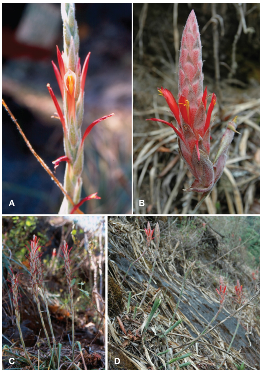
Fig. 1. A y C. Pitcairnia roseana L.B. Sm. (A. R. López-Ferrari et al. 2404). B y D. P. yocupitziae Espejo & López-Ferrari (Y. Ramírez-Amezcuca et al. 969).