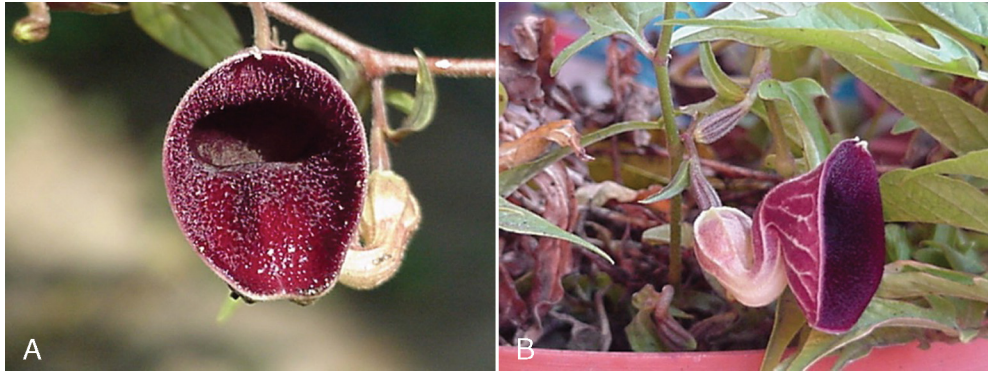
Fig. 2. Flor de Aristolochia emiliae vista de frente (A) y de costado (B).

lóbulos de 1-1.5 mm de largo, estípites de 0.5-1 mm de largo, estambres 5, anteras de 1.5-2 mm de largo, 1 mm de ancho; fruto una cápsula ovoide 5-carpelar, piloso, de 2-3 cm de largo, 1.7-2.5 cm de diámetro, dehiscencia basicaida, semillas triangulares, numerosas, negras, de 5-6 mm de largo, 4.5-5.5 mm de ancho, 1 mm de grueso, superficie finamente tuberculada.