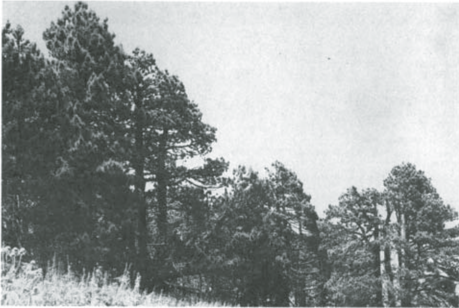
Fig. 5. Bosque de Pinus hartwegii .