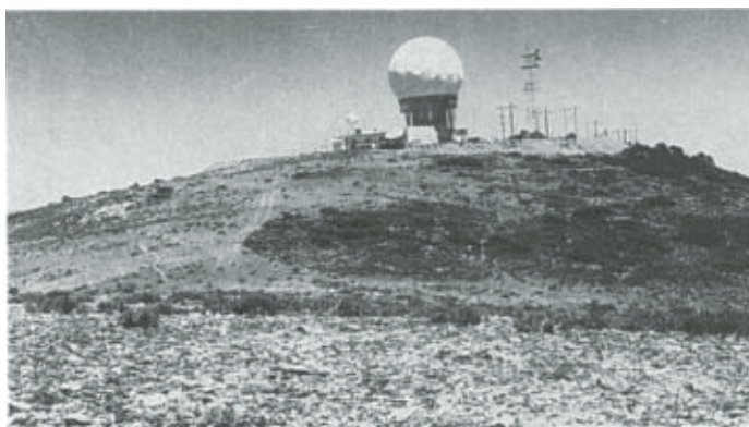
Fig. 1. Panorámica de la cima del Cerro Potosí. En primer plano pradera alpina. Parte alta: instalaciones de la Secretaría de Comunicaciones y Transportes.

El Cerro Potosí forma parte de la Sierra Madre Oriental al sur del estado de Nuevo León. Alcanza una altitud de 3670 m s.n.m. y representa la cima de mayor altura del norte de México. Su aislamiento geográfico y diferencias en el sustrato geológico con respecto al de otras altas montañas determinan la existencia de un alto porcentaje de especies endémicas (Rzedowski, 1978). La zona está fuertemente afectada por disturbio antropogénico, principalmente construcciones realizadas por la Secretaría de Comunicaciones y Transportes, así como por incendios y pastoreo (Fig. 1).