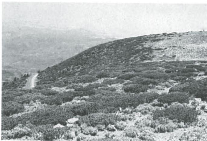
Fig. 3. Matorral de Pinus culminicola . Pradera subalpina en extremo superior derecho.

Una asociación común en el ecotono con la pradera subalpina es la de Pinus culminicola rodeado por Senecio loratifolius y Lupinus cacuminis . En las áreas de matorral abierto se presenta una diversidad florística relativamente alta, la cual disminuye conforme la comunidad se torna más densa.