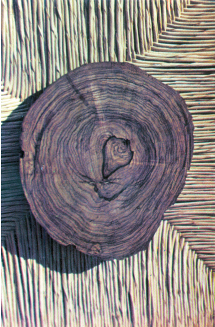
Fig. 2. Dalbergia palo-escrito Rzedowski & Guridi-Gómez. Corte transversal del tronco de un individuo joven.